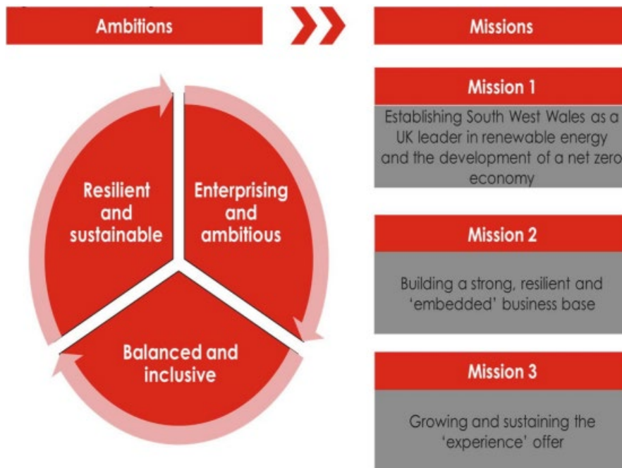
Ffigur 1: CCERh – Uchelgeisiau a Nodau (Cymerwyd o'r CCERh)